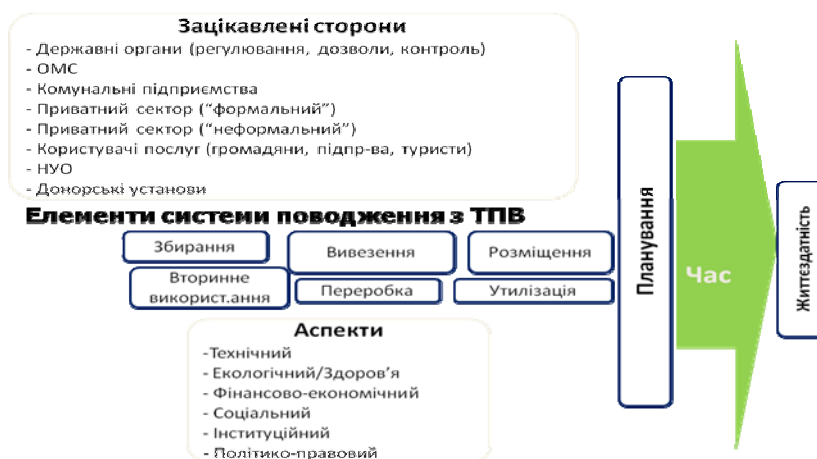
Рис. 1. Концепція Інтегрованого підходу до ПТПВ

Усталена практика, коли переважна більшість органів місцевого самоврядування (ОМС) розглядають поводження з ТПВ лише як завдання очищення населеного пункту (якщо взагалі система збору та вивезення відходів існує) і не приділяють увагу тому, що відбувається із відходами після цього, нехтують у політичних цілях екологічною (погіршення навколишнього середовища) та економічною (як правило, тарифи не відповідають витратам) складовими у цій діяльності, вже не спрацьовує. Важливим є врахування усіх ключових позицій та компонентів, які й складають зміст Інтегрованого підходу до поводження з твердими побутовими відходами (ПТПВ). (Рис.1)